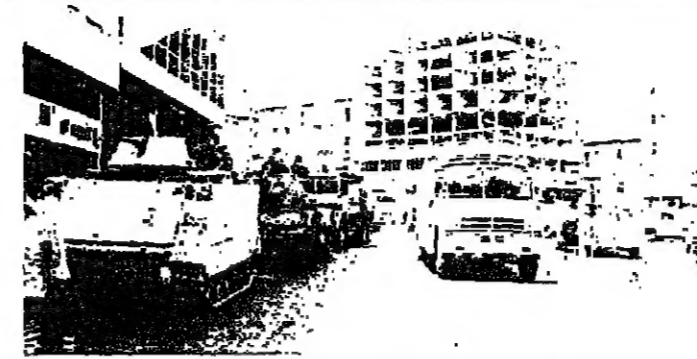
العودة من الجبال الى بيروت